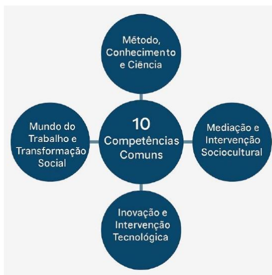
Parâmetros Nacionais - Itinerários Formativos de

Assim, para o Ensino Médio Técnico e Profissional, considerando o preposto, orienta-se a sistematização dos Eixos Estruturantes “Mundo do Trabalho e Transformação Social” e “Inovação e Intervenção Tecnológica”, organizada pela distribuição de Atribuições Empreendedoras aplicadas às nomenclaturas funcionais de Planejamento, Execução e Controle, bem como às Áreas de Ação Empreendedora de Análise e Planejamento, Ações Comportamentais e Atitudinais, Liderança, Integração Social, Criatividade e Inovação, estruturadas e em alinhamento direto com as Dez Competências Gerais dos Itinerários Formativos, como segue: